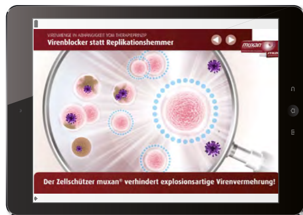
Muxan® Ipad Gespräch mit Lupenanimation

Das Prospan® Ipad Spiel weckt Neugier und Ehrgeiz der Ärzte oder Apotheker. Wichtige Produktbotschaften spielerisch verpackt – ein Außendienstbesuch auch mit Unterhaltungswert.