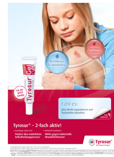
Tyrosur® Abgabekarte mit Fühlzone

Wirkung und Verträglichkeit Ihres Produktes sensitiv erleben. Unsere Tyrosur® Abgabekarte mit Fühlzone hat bleibenden Eindruck hinterlassen.